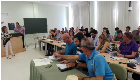
Primera sesión Común de Institutos