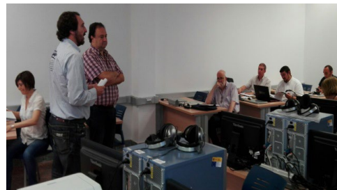
Sesión 2 Plan Director ILA