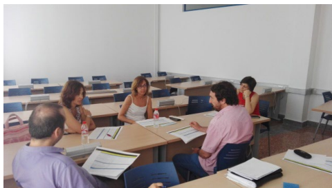
Sesión 3 Plan Director ILA