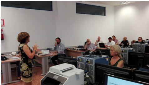
Sesión 2 Plan Director ILA