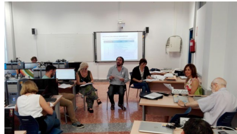
Sesión 2 Plan Director ILA