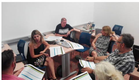
Sesión 3 Plan Director ILA