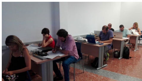
Sesión 3 Plan Director ILA